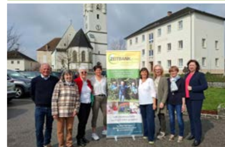
Die Zeitung der Gemeinde Arbing

In Arbing feierte der Verein Zeitbank plus sein zehnjähriges Bestehen. Diese Initiative fördert Nachbarschaftshilfe und Menschlichkeit in einer hektischen Welt. Mitglieder tauschen ihre Talente und Fähigkeiten, indem sie „Zeit“ auf einem digitalen Konto gutgeschrieben bekommen. Das System ermöglicht gegenseitige Unterstützung, sei es bei Computerhilfe, Kinderbetreuung, im Haushalt oder anderen Dienstleistungen.