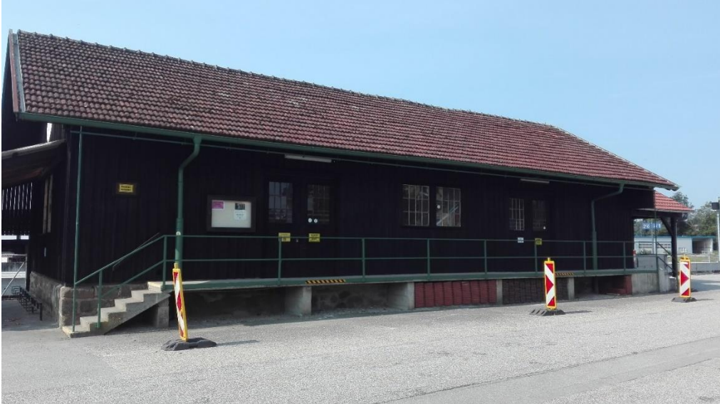
Das ÖBB Magazin: Nicht nur Lagerstätte, auch Lärmschutz für die Bahnhofssiedlung.