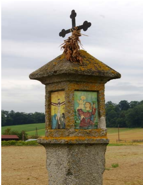
(Im Bild: Marterl Im Weingarten)

Gemeinderat Josef Hiesböck möchte unsere Arbinger Kleindenkmäler erheben und ihre Geschichte dokumentieren. Dazu ersucht er um Mithilfe der Bevölkerung.