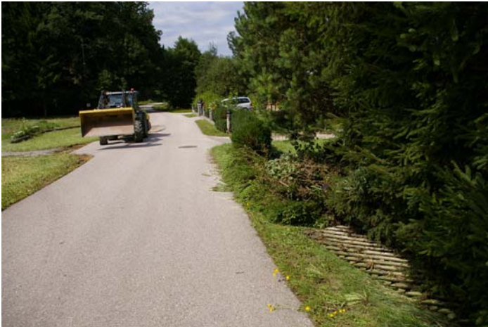
(Neuhauserbach - Güterweg Hummelberg beim Eislaufplatz)

Straßen wurden blockiert, Brücken ausgeschwemmt, Bäume entwurzelt, Keller überflutet und Gärten mit Schlamm überzogen.