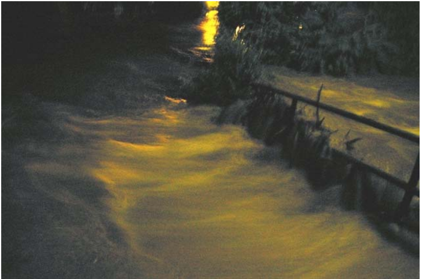
Arbingerbach: Überflutung der Brücke zu den Anwesen Daniel und Lettner im Rosental neben der Arbinger Bezirksstraße

Nach einer Aufstellung des Hydrografischen Dienstes war dies ein 100-jähriges Starkregenereignis .