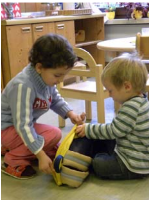
Komm ich helfe dir