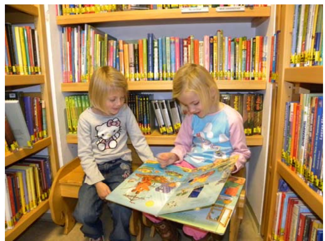
Schulanfänger reisen in die Bibliothek nach Perg