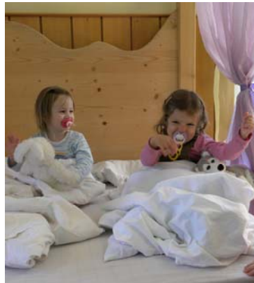
Wir spielen „Schlafen gehen“