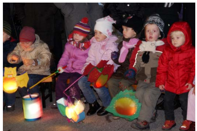
Ich gehe mit meiner Laterne

Vielen Dank auch für die großartige Hilfe aller Eltern und Helfern zu einem gelungenen Martinsfest. Dank auch an die FA. Pachinger( Leberkäse) und Fa. Kern (Semmerl) für ihre Spenden zum Martinstandl.