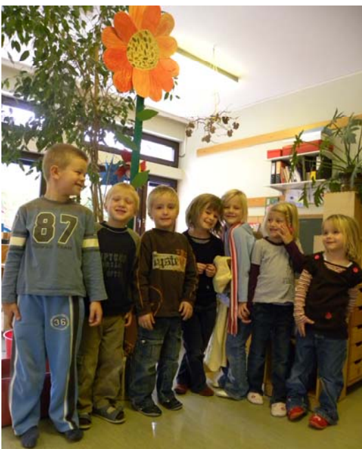
Alle haben wir zusammen geholfen, jetzt ist sie fertig.