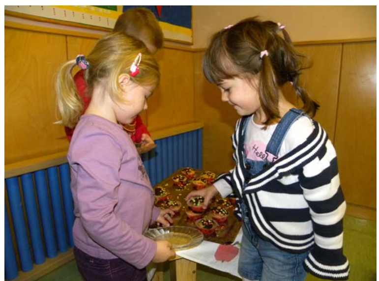
Magst du auch etwas von meinem Geburtstagskuchen?