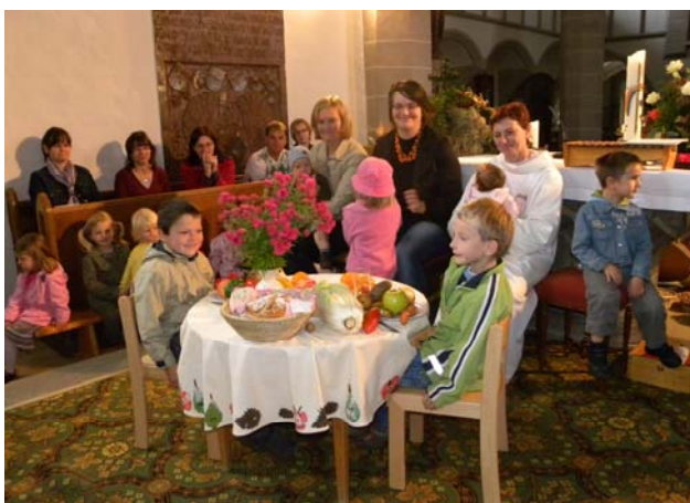
Erntedankfest in gemütlichem Kreise

Nach 2 Monaten haben sich alle gut eingewöhnt und die Herausforderung des Neuen macht Spaß. Feste wurden gefeiert: