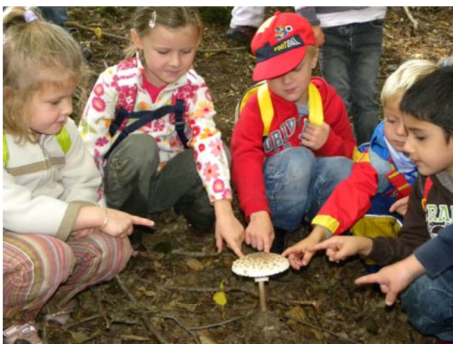
Giftig oder nicht ? Der Wald bietet reiche Erfahrungen