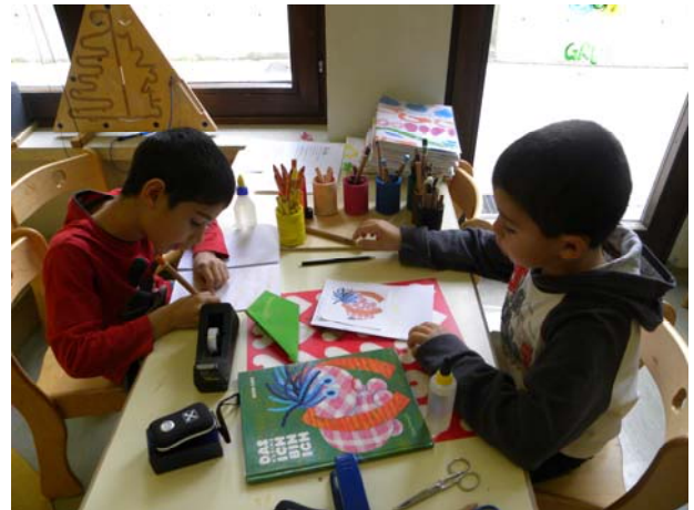
das „ kleine Ich bin ich“ Projekt