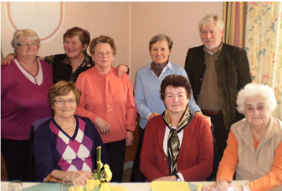
Mittagessen beim Wirt in Pasching.

Anmerkung: * Inzwischen hat in unserer Nachbargemeinde Baumgartenberg die 1.000. SelbA Trainingsgruppe gestartet!!!