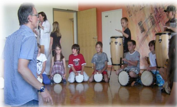
Schulchor der VS-Arbing