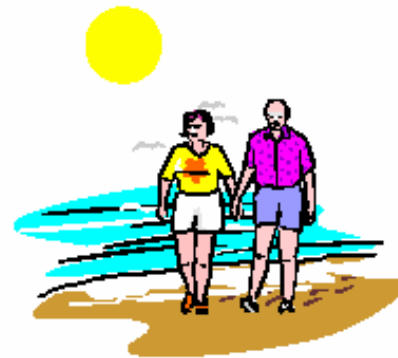
Wir wünschen einen schönen, erholsamen Urlaub

Mit dem Euronotruf 112 rufen Sie im Ausland um Hilfe.