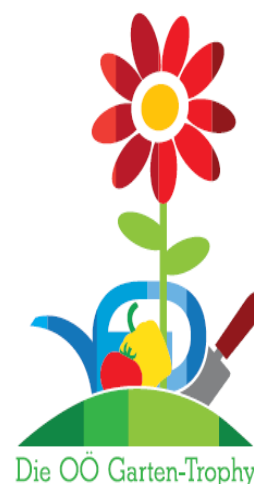
Die OÖ Garten-Trophy

Bewertet wird die Gemüsevielfalt vom Balkon bis zum Gemüsebeet.